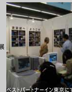
ベストパートナーイン東京にて